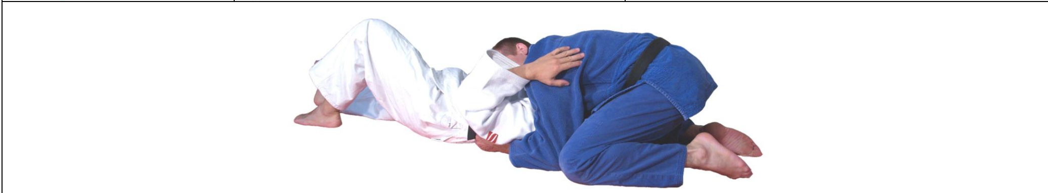
Yoko-Ukemi Judorolle Seitwärts