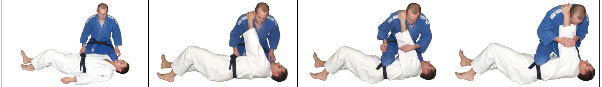
Ude-Hishigi-Hiza-Gatame Arm biegen durch Knie Kontrolle