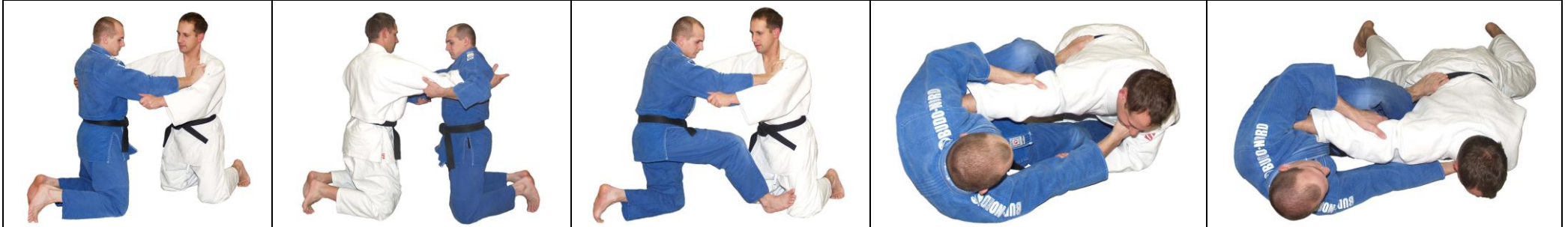
Ude-Hishigi-Sankaku-Gatame Arm biegen durch Dreiecks Kontrolle / Sankaku-Gatame Dreiecks Würger